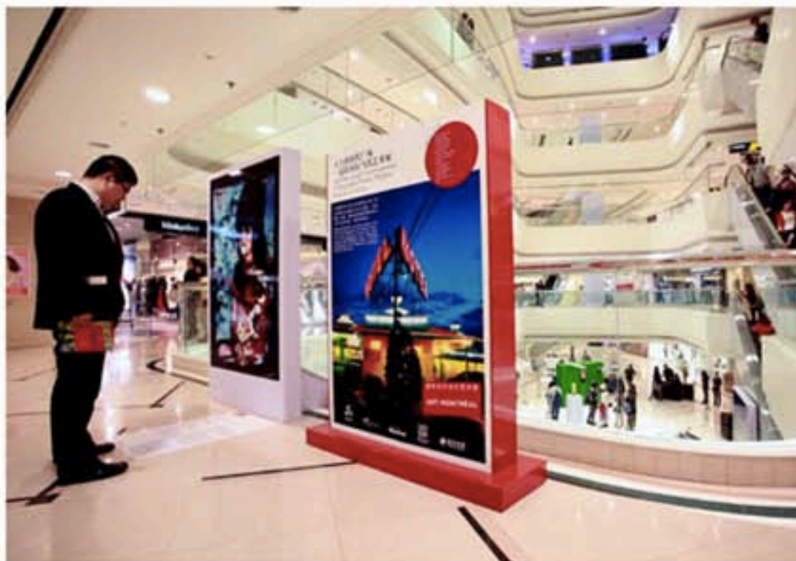
观众在大上海时代广场饶有兴趣地欣赏展品。