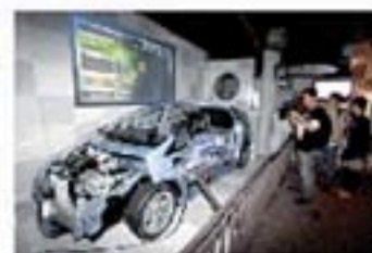
蒙特利尔案例馆使用垃圾发电