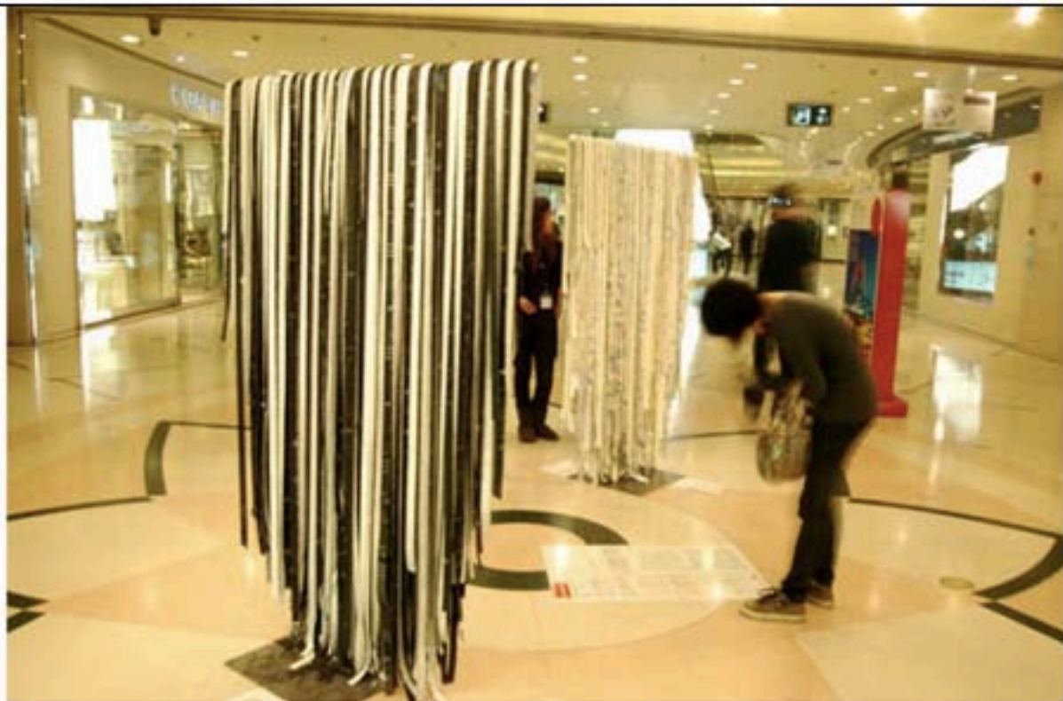
Jérôme Fortin, Autoportrait no. 1, 2007