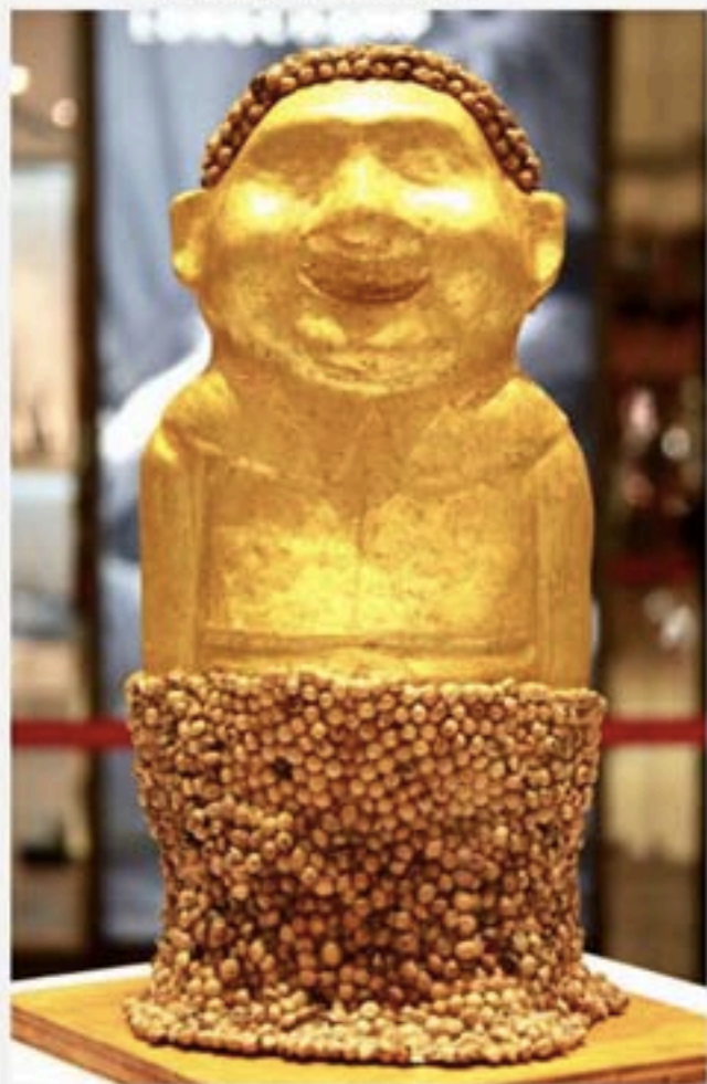
大上海时代广场的艺术雕塑。