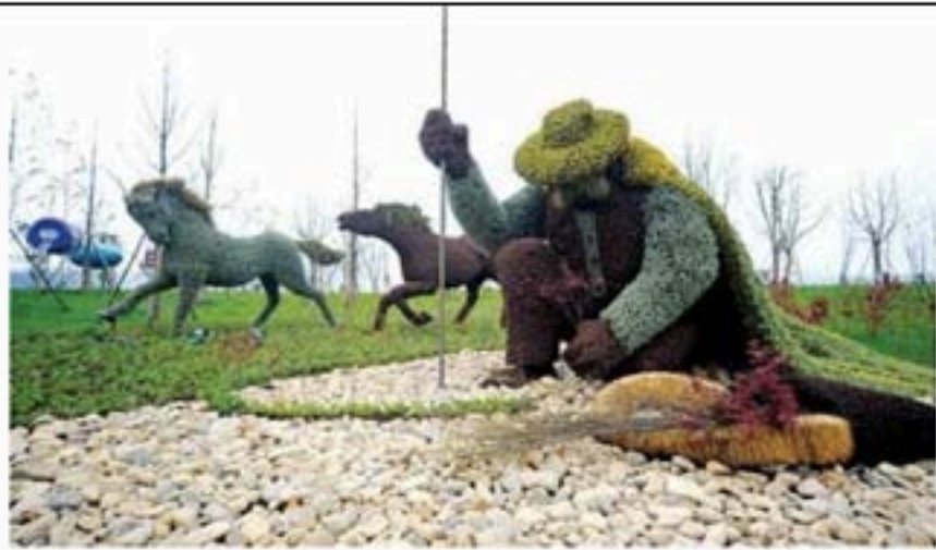
植物搭就的大型绿色雕塑——《植树人》

此外，在世博会特别指定的“蒙特利尔日”、即5月14日，蒙特利尔为世博会度身设计的两场艺术表演绚丽登场。总部位于蒙特利尔、享誉世界的现代马戏艺术领袖——爱卢瓦兹马戏团（Cirque Eloize），带来了“穿越11,373公里庆友谊”大型现代马戏表演。这出剧目的灵感源自蒙特利尔一个古老传说：如果在脚底挖掘隧道，便可穿越地球到达古老的东方国度——中国。此外，国际上备受瞩目的小提琴大师安琪尔·迪博（Angèle Dubeau）和她的La Pietà女子弦乐团共同演绎了“蒙特利尔专场音乐会”。整场演出由6部风格各异的音乐作品组成，观众跟随着美妙的音乐穿越时空，踏上奇妙的环球之旅。