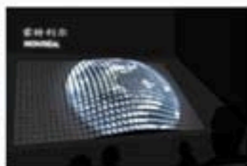
展区内动态多媒体影像投影