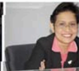
泰国馆馆长：泰国的快乐