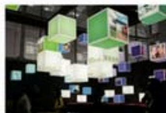
蒙特利尔案例馆展厅