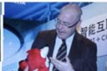
安索尼：展示智能互联生活