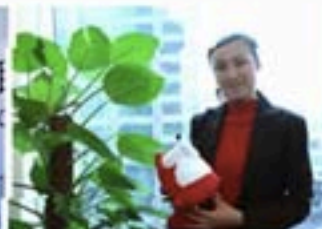
阳月：“大篮子”充满惊喜