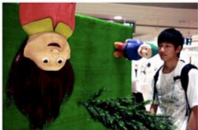
作品《你的气息》效果独特。