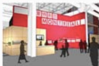
蒙特利尔案例馆效果图