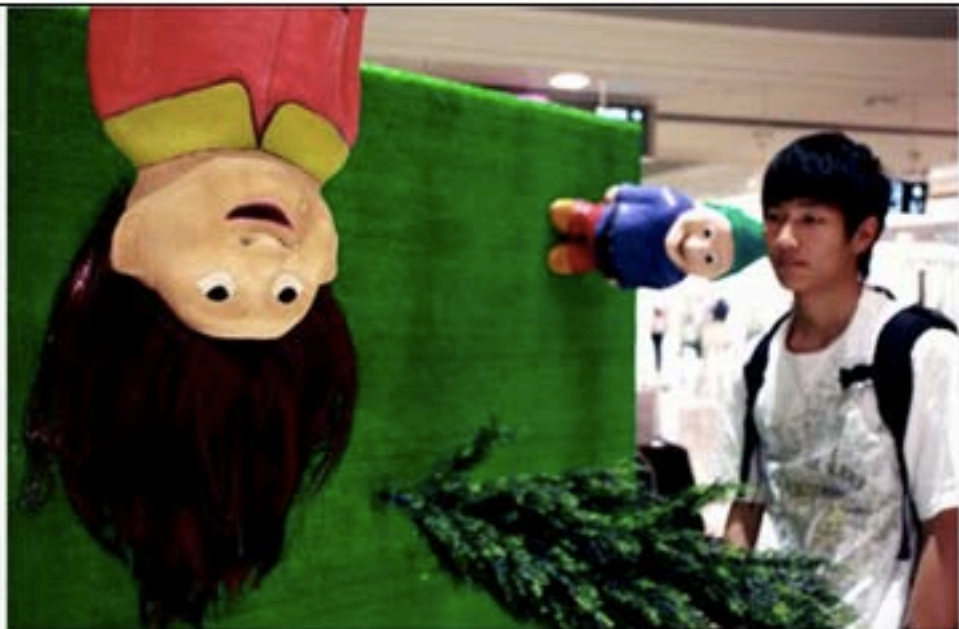
作品《你的气息》效果独特。