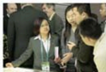
工作人员介绍城市环境治理心得